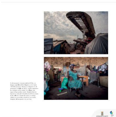
Contexto A, Panel 4